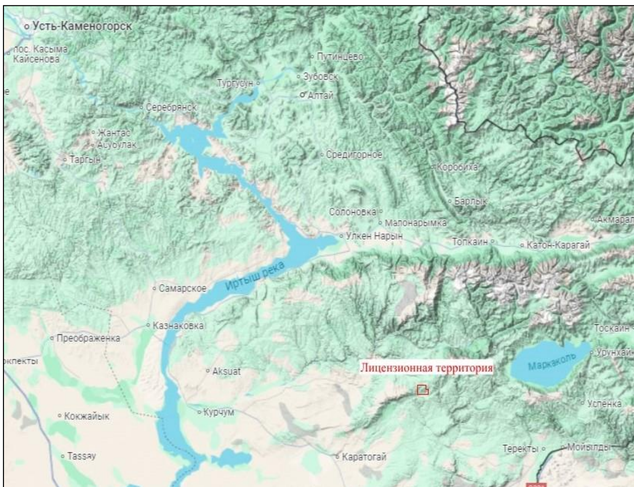
Рисунок 1. Обзорная карто-схема расположения участка Кызылтас-Курчум.

2) описание затрагиваемой территории с указанием численности ее населения, участков, на которых могут быть обнаружены выбросы, сбросы и иные негативные воздействия намечаемой деятельности на окружающую среду, с учетом их характеристик и способности переноса в окружающую среду; участков извлечения природных ресурсов и захоронения отходов: